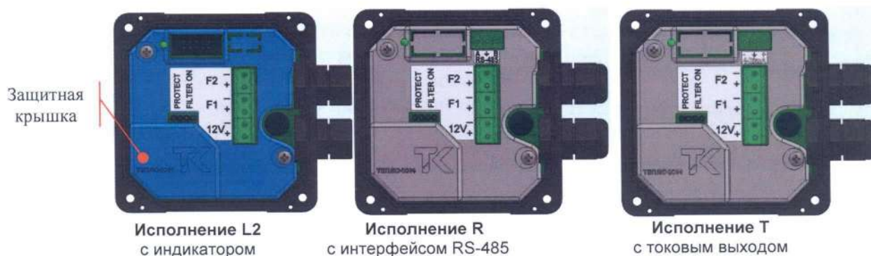
Рисунок 2 - Общий вид конструктивных исполнений ЭБ с защитной крышкой

Для предотвращения несанкционированного вмешательства в работу преобразователя предусмотрены способы защиты, блокирующие изменение метрологических характеристик, внесение изменений в электронный модуль, отключение соединительных линий, демонтаж преобразователя.