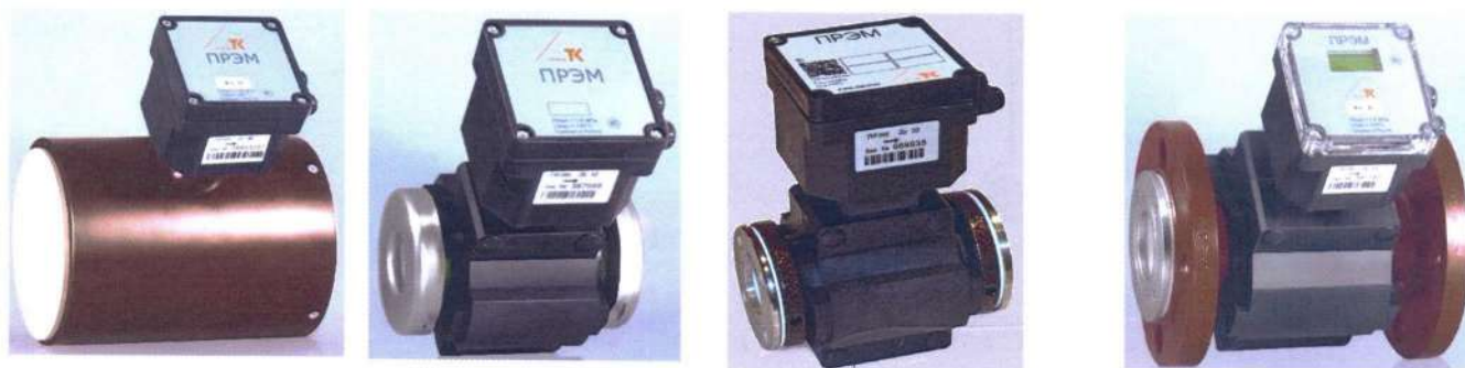
а) Исполнение «сэндвич» без защиты футеровки

Преобразователи имеют различные конструктивные исполнения (рис. 1), определяющие способы монтажа на трубопроводе.